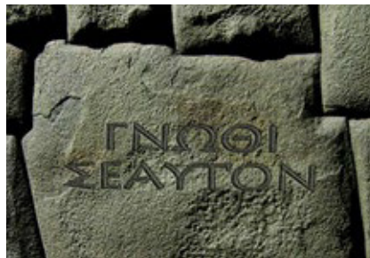
gnothi seauton (ken uzelf)

In de traditionele christelijke godsvoorstelling is er een onoverbrugbare afstand tussen de mens en God. Mens en God zijn wezensongelijk. Maar in de gnostiek is dat anders. Wij zijn als mens rechtstreeks met de bron verbonden. Zoals een lichtstraal verwant is aan de zon, zo is ook de mens verwant aan de Bron. Wij hebben 'de gelaatstreken van de Vader'. Wij zijn 'de erfgenamen van de Vader'. Dat zijn uitdrukkingen in gnos-