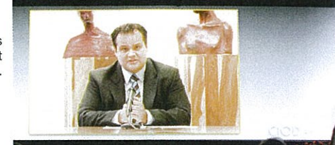
De staatssecretaris benadrukte het belang van ict.