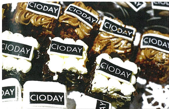
Volop aandacht voor de inwendige mens.