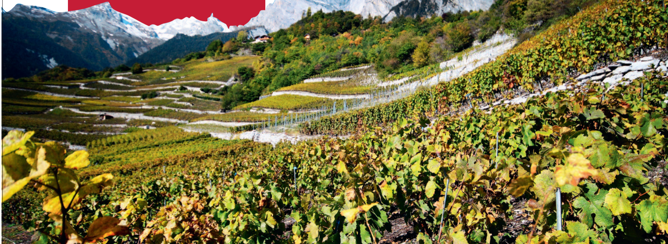
De wijngaarden van Chamoson, niet ver van Sion.