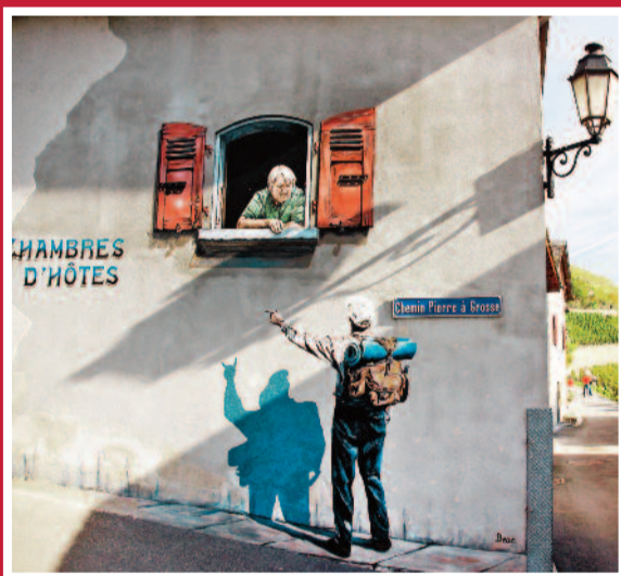
Niets is wat het lijkt in Branson: een muurschildering van een wandelaar die de weg vraagt.

Gids: Het tweetalige Chemin du Vignoble/Weinweg beschrijft de 22 etappes en must-sees onderweg. Te bestellen (10 CHF) op www.cheminduvignoble.ch