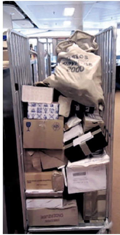
Tweedehands klassieke cd's komen met kisten de redactie binnen.