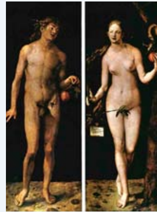
Schilderij: Albrecht Dürer (1507)

Adam en Eva zijn volgens de bijbel de eerste man en vrouw. Het boek Genesis vertelt dat God Adam schiep door leven te blazen in het "stof der aarde". Later creëerde Hij Eva uit een rib van Adam. God had een doel met de mens. Hij zegende hen en zei hen: 'Wees vruchtbaar en word talrijk, bevolk de aarde en breng haar onder je gezag: heers over de vissen van de zee, over de vogels van de hemel en over alle dieren die op de aarde rondkruipen'. Adam en Eva werden in de Hof van Eden (het Aards Paradijs) gelaten en God vertelde hen dat zij het fruit van alle bomen in de tuin konden eten, behalve dat van de boom van de kennis van goed en kwaad. Zij leefden gelukkig tot de slang Satan Eva verleidde de verboden vrucht (appel) te eten. Dit deed ze en zette Adam aan hetzelfde te doen. Zij werden zich direct bewust van hun naaktheid en schaamden zich. Dankzij hun ongehoorzaamheid werden Adam en Eva uit de Hof van Eden gestuurd naar de buitenwereld. Eva beviel van haar kind en moest in Adams levensonderhoud voorzien. Het grootste gevolg van hun ongehoorzaamheid was echter de dood: "U bent als stof gekomen, en zal als stof terugkeren", zei God. Na te zijn verdreven uit het Hof van Eden, kreeg Eva drie zonen, Kaïn, Abel en Seth. Zo werden Adam en Eva de ouders van het mensdom. Volgens de Joodse gemeenschap liggen Adam en Eva in de Grot van Machpelah begraven in de buurt van Hebron.