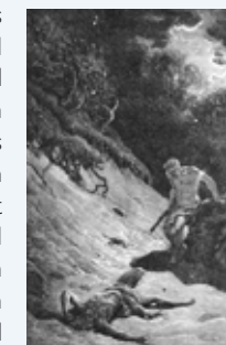
Gravure: Gustave Doré

De oudste van de twee broers Kain was een landbouwer; Abel was schaapherder. Abel vond de dood door toedoen van zijn broer, omdat God Abels offer (lamsvlees) wel aannam en een deel van de oogst (het offer van Kain) niet. Het verhaal (Genesis 4) geeft geen reden voor de broedermoord en voor Gods voorkeur. Als God Kain vraagt of hij weet waar Abel is, antwoordt deze "Ben ik mijn broeders hoeder?" Kain wordt door God vervloekt en veroemd tot zwerven. Hij vertrekt naar "het land Nod, ten oosten van Eden,"; nod is Hebreeuws voor "zwervende", dus het kan zijn dat met dit woord niet een land bedoeld wordt. Kain sticht hier een stad (de eerste waar in de bijbel naar verwezen wordt) die hij de naam Henoch geeft, naar zijn zoon. Verder beschermt God Kain met een "teken", zodat niemand hem kwaad zal doen. God belooft Kain zijn eventuele moord zeventvoudig te wreken. Na Abels dood krijgen Adam en Eva nog een kind, ter "vervangning" van Abel, Seth. De genealogieën van Kain en Seth komen dusdanig overeen qua namen dat het idee is geopperd dat Seth later is toegevoegd aan het verhaal om te voorkomen dat alle mensen volgens de bijbel van de broedermoordenaar Kain zouden afstammen.